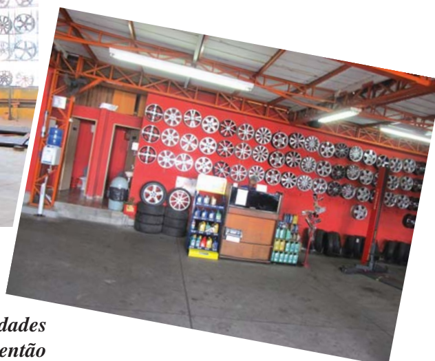
Bacana Centro Automotivo, iniciou suas atividades junto ao comércio de Taubaté em 1987, desde então vem procurando cada vês mais se aprimorar para melhor atender ao público desta cidade e região.